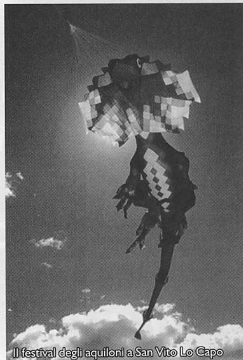
Il festival degli aquiloni a San Vito Lo Capo

Una serie di iniziative che hanno portato il tutto esaurito da giugno a settembre e che dimostra come non basta soltanto una bella spiaggia a richiamare i turisti.